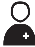
Notfall-Termin beim Arzt